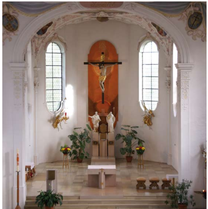
Der neugestaltete Chorraum mit dem spätbarocken Kreuz, 1998

Chor, Turmunterbau und möglicherweise auch der Kern des Langhauses gehören dem ausgehenden 15. oder frühen 16. Jahrhundert an. In den Jahren 1653/54 werden Kanzel und Kirchengestühl ausgebessert, die Kirche erhält drei neue Altäre. Da die Pfarrei zum Grundbesitz des Benediktinerklosters und späteren Reichsstiftes St. Ulrich und Afra gehört, veranlasst der baufreudige Abt Willibald Popp 1729 die erste Umgestaltung und beschert St. Georg unter anderem neue Deckengemälde. Sein Wappentier, das springende silberne Pferd, wird später in das Haunstetter Wappen aufgenommen. Auch das goldene Kleeblattkreuz im heutigen Wappen weist auf die 800-jährige Verbundenheit Haunstettens mit dem Reichsstift hin.