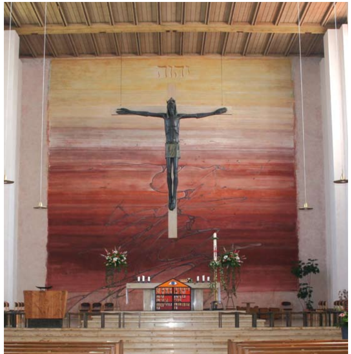
Der neugestaltete Innenraum