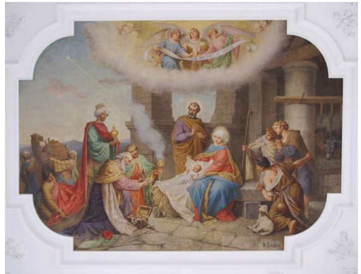
„Anbetung der Könige und der Hirten“ Deckengemälde von Bonifaz Locher, 1887

Ein Kleinod ist die im Rokokostil erbaute Muttergotteskapelle, die der Pfarrei von der Stadt Augsburg als Eigentümerin zur Verfügung gestellt ist. Unzählige Brautpaare haben in dem romantischen Kirchlein bereits geheiratet.